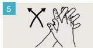
Frótese las palmas de las manos entre sí, con los dedos entrelazados.