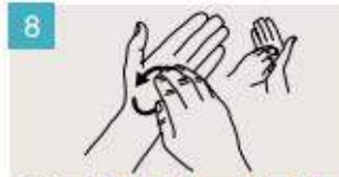
Frótese la punta de los dedos de la mano derecha contra la palma de la mano izquierda, haciendo un movimiento de rotación, y viceversa.