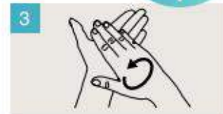
Frótese las palmas de las manos entre sí.