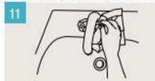
Utilice la toalla para cerrar el grifo.