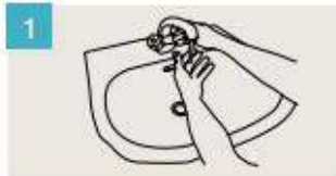
Mójese las manos.

DURACIÓN DEL LAVADO: entre 40/60 segundos