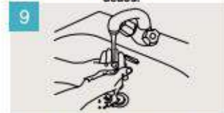
Enjuáguese las manos.