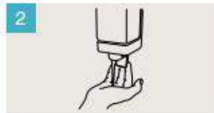
Aplique suficiente jabón para cubrir todas las superficies de las manos.