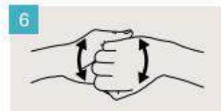
Frótese el dorso de los dedos de una mano contra la palma de la mano opuesta, manteniendo unidos los dedos.