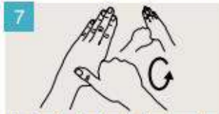
Rodeando el pulgar izquierdo con la palma de la mano derecha, fróteselo con un movimiento de rotación, y viceversa.