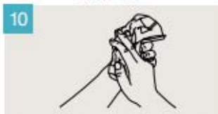
Séquese las manos con una toalla de un solo uso.