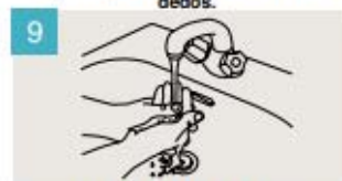
Enjuáguese las manos.