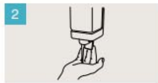
Aplique suficiente jabón para cubrir todas las superficies de las manos.