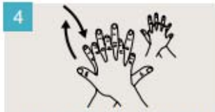
Frótese la palma de la mano derecha contra el dorso de la mano izquierda entrelazando los dedos, y viceversa.