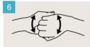
Frótese el dorso de los dedos de una mano contra la palma de la mano opuesta, manteniendo unidos los dedos.