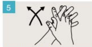
Frótese las palmas de las manos entre sí, con los dedos entrelazados.