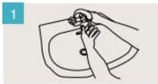
Mójese las manos.

DURACIÓN DEL LAVADO: entre 40/60 segundos