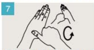
Rodeando el pulgar izquierdo con la palma de la mano derecha, fróteselo con un movimiento de rotación, y viceversa.