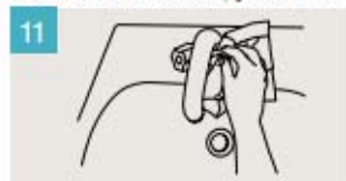
Utilice la toalla para cerrar el grifo.