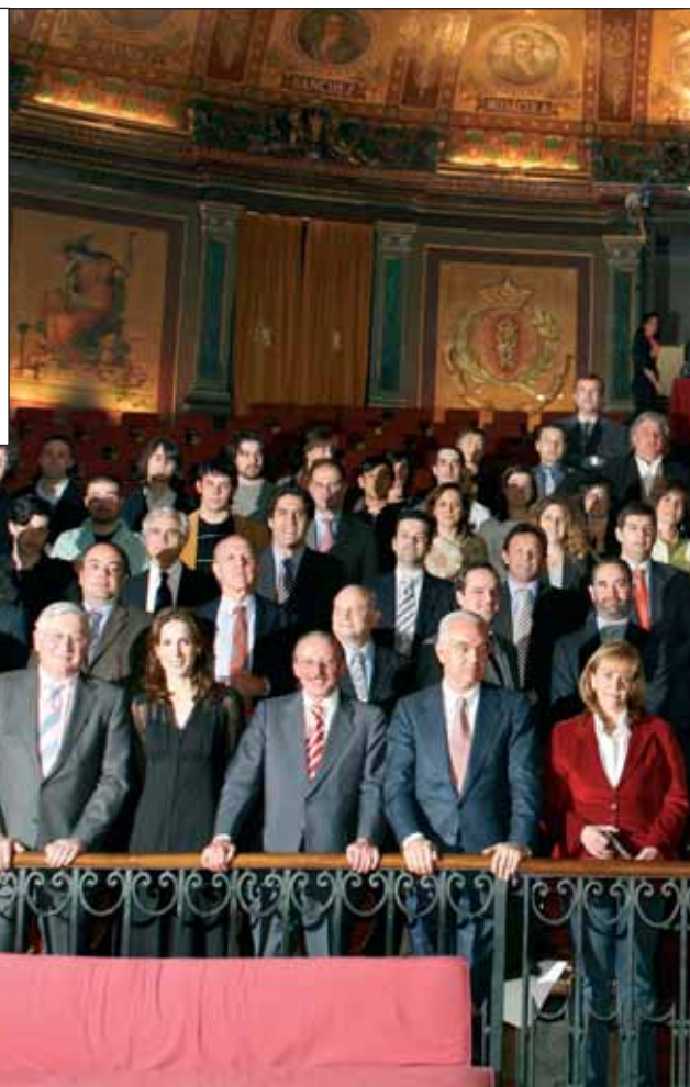
Vista general del auditorio